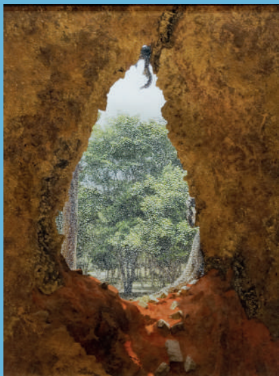
Raphaëlle Peria, Spelunca est templum , dessin à l'encre, pigment, dorure et grattage sur photographie, 60 x 45 cm, 2019