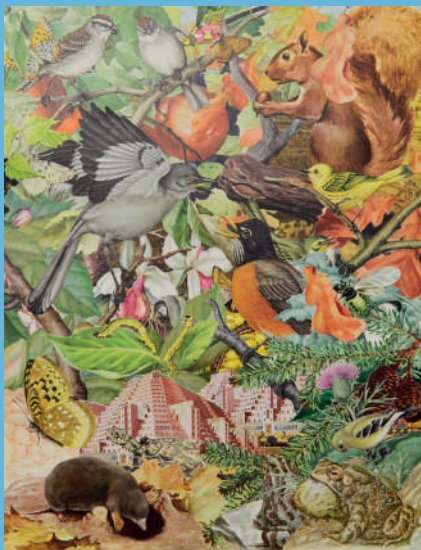
Quentin Montagne, Les Merveilles de la nature, ou Henri Sauvage dans les bois #1 , 2019. Illustrations découpées et collées sur papier, 33x25,6 cm. Collection FDAC.