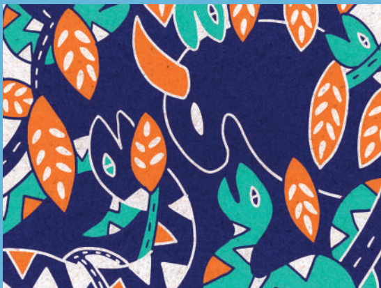
Claire Astigarraga et Sophie Dang Vu, Les feuilles de cuivre , extrait (détail) du conte illustré Le Taureau Bleu , 2019

Résidence du 11 juillet au 6 septembre 2019