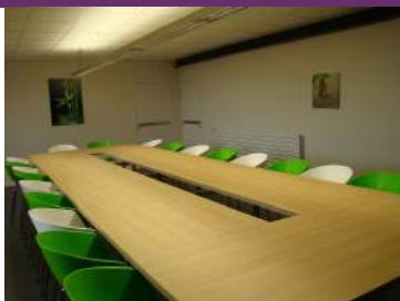
© Salle du pont aux chèvres

Contact : 35137 06 07 46 30 97 gerard.basselot@wanadoo.fr