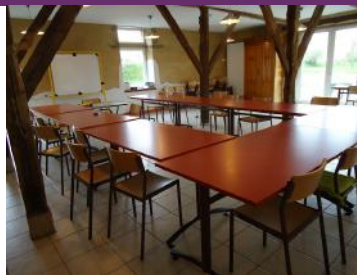
© Office de tourisme de Montfort Communauté

Contact : La Besneraye 35137 02 99 07 09 73 gite.labesneraye@hotmail.fr